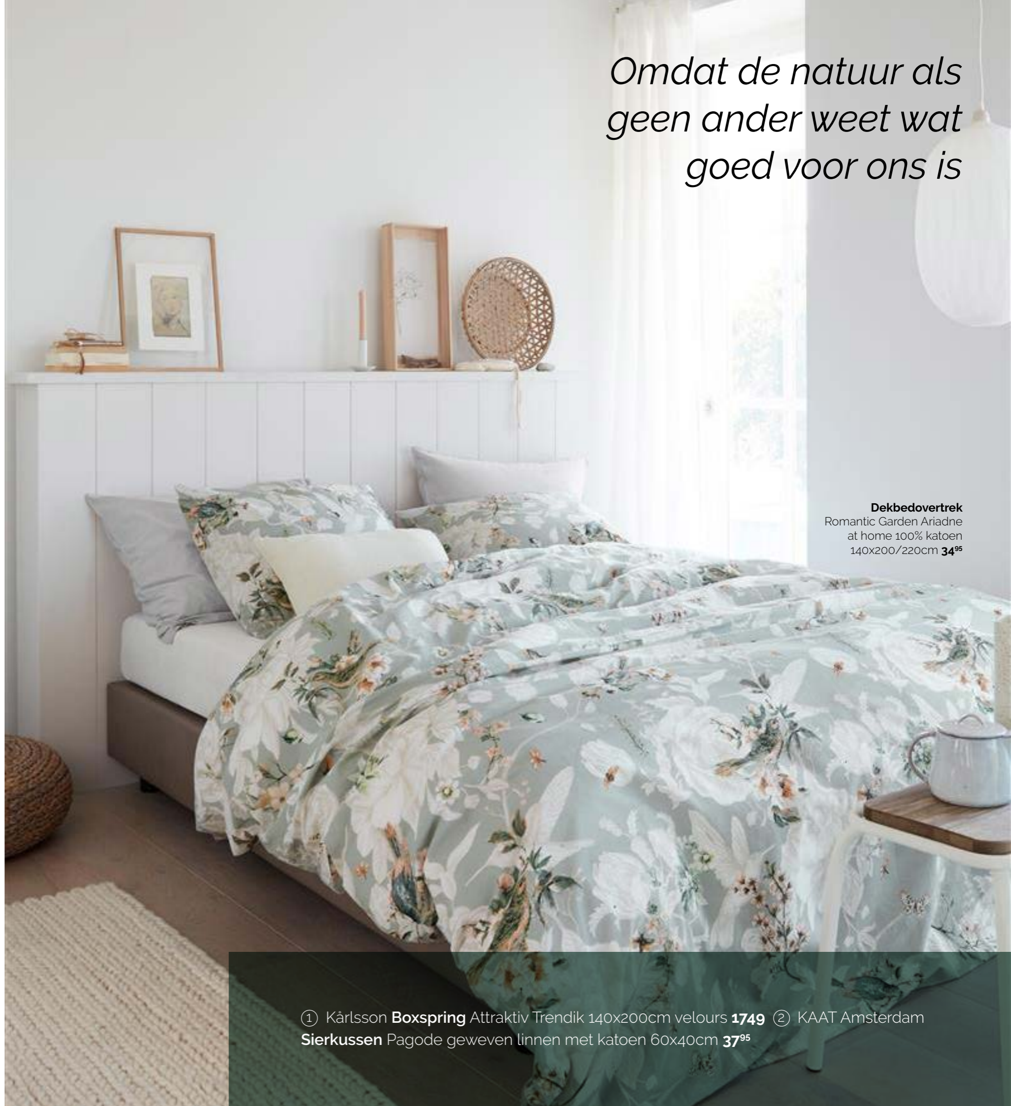
Dekbedovertrek Romantic Garden Ariadne at home 100% katoen 140x200/220cm 34 95

Omdat de natuur als geen ander weet wat goed voor ons is