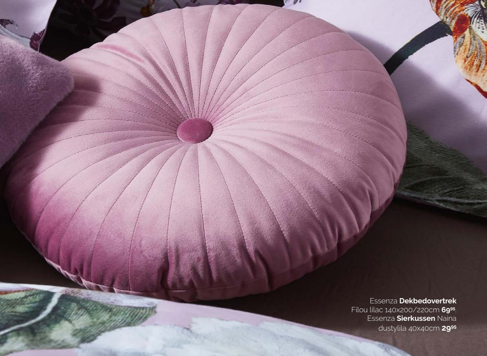
Essenza Dekbedovertrek Filou lilac 140x200/220cm 69 95 Essenza Sierkussen Naina dustylila 40x40cm 29 95