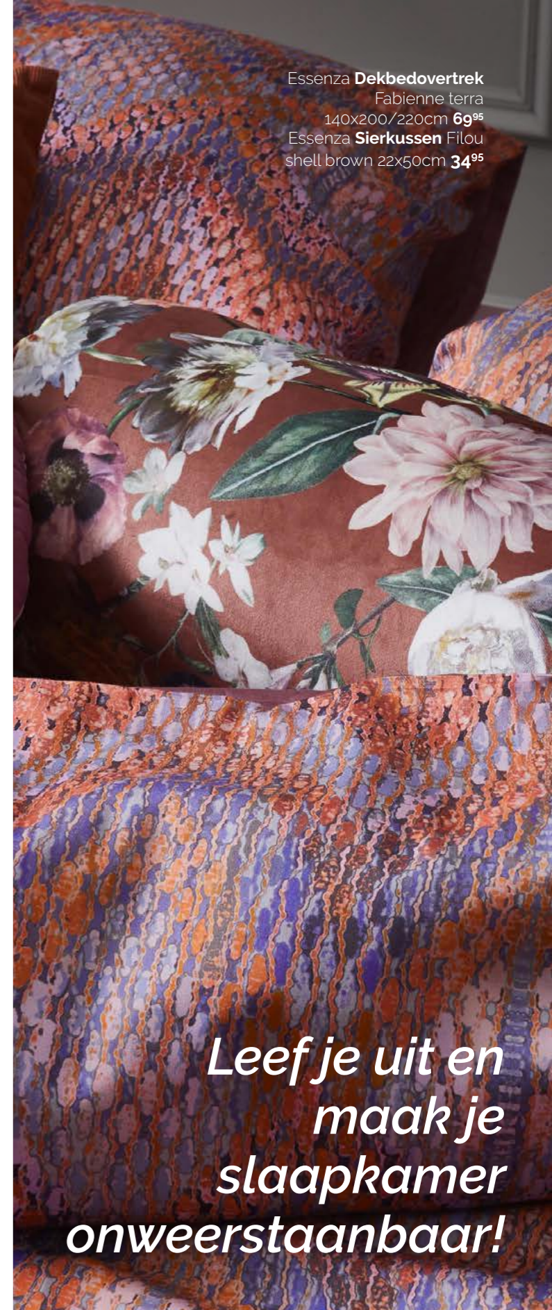
Essenza Dekbedovertrek Fabienne terra 140x200/220cm 69 95 Essenza Sierkussen Filou shell brown 22x50cm 34 95

Leef je uit en maak je slaapkamer onweerstaanbaar!