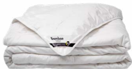
Bamboo zomer dekbed 140x200 44 95