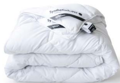
rPet dekbed 140x200 94 95