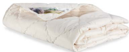
Texeler Tencel Dekbed 140x200 179.-